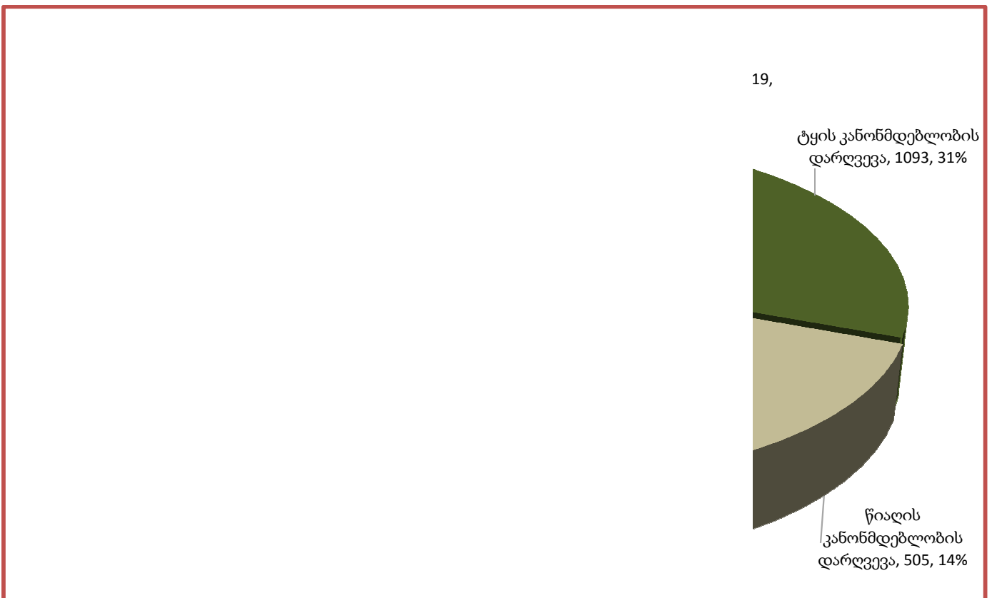
დიაგრამა 3. სამართალდარღვევათა სტრუქტურა, იანვარი-ივნისი, 2015 წ.